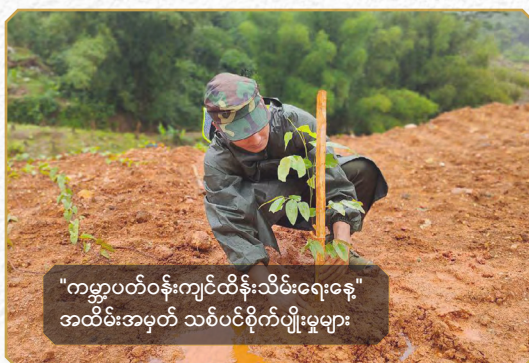
"ကမ္ဘာ့ပတ်ဝန်းကျင်ထိန်းသိမ်းရေးနေ့" အထိမ်းအမှတ် သစ်ပင်စိုက်ပျိုးမှုများ

၂၀၂၂ ခုနှစ် ကမ္ဘာ့ပတ်ဝန်းကျင် ထိန်းသိမ်းရေးနေ့ အထိမ်းအမှတ် အဖြစ် အမျိုးသားညီညွတ်ရေးအစိုးရ၊ သယံဇာတနှင့် သဘာဝပတ်ဝန်းကျင် ထိန်းသိမ်းရေး ဝန်ကြီးဌာနနှင့် စီးပွားရေးနှင့် ကူးသန်းရောင်းဝယ်ရေးဝန်ကြီးဌာနတို့ ပူးပေါင်း၍ "Environmental, Social, Governance" ခေါင်းစဉ်ဖြင့် အွန်လိုင်း သင်တန်းတစ်ရပ်ကို ၂၀၂၂ ခုနှစ်၊ ဇွန်လ (၅) ရက်နေ့ ညနေ (၆) နာရီမှ (၈) နာရီအထိ ဆွေးနွေး ဟောပြောခဲ့သည်။